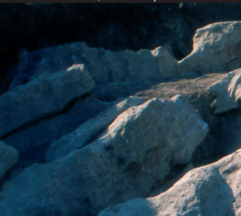
Monte Finestrelle, tumbas rupestres

conservados en el Museo Arqueológico de Palermo. En la parte apical del Monte se ha hallado además una gran cratera (ánfora) con decoración geométrica, de una altura de 40 cm. Excavaciones efectuadas en la parte oeste del Monte han evidenciado en cambio los restos de un pequeño asentamiento prehistórico.